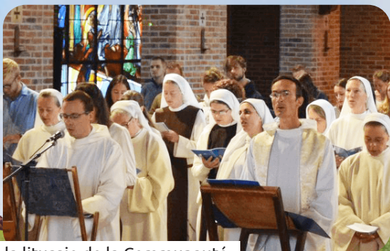
la liturgie de la Communauté