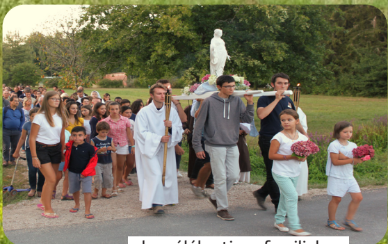
des célébrations familiales