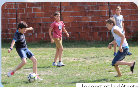
le sport et la détente

Famille Amoris Laetitia Année 2021 - 2022